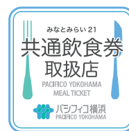
加盟店舗表示ステッカー Affiliated Restaurant Sticker