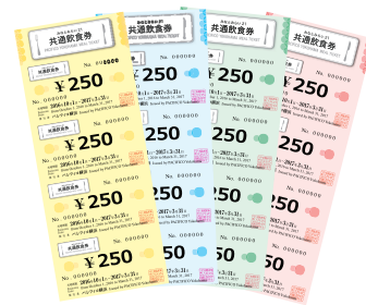
チケット見本 Tickets Sample

みなとみらいの美味しいお店で、講師の先生にお昼を食べていただく お弁当の数が間に合わなかった！ チケットを買って食べに行ってもらおう